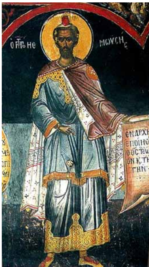
Sfântul Prooroc Moise

Avem și noi madianiții zilelor noastre, iar aceștia sunt, după cum ne învață sfântul Nil Ascetul, toți cei care aduc desfrânarea în popor cu scopul de a-l supune și a-l stăpâni mai ușor. Și cine este oare astăzi poporul lui Dumnezeu, dacă nu