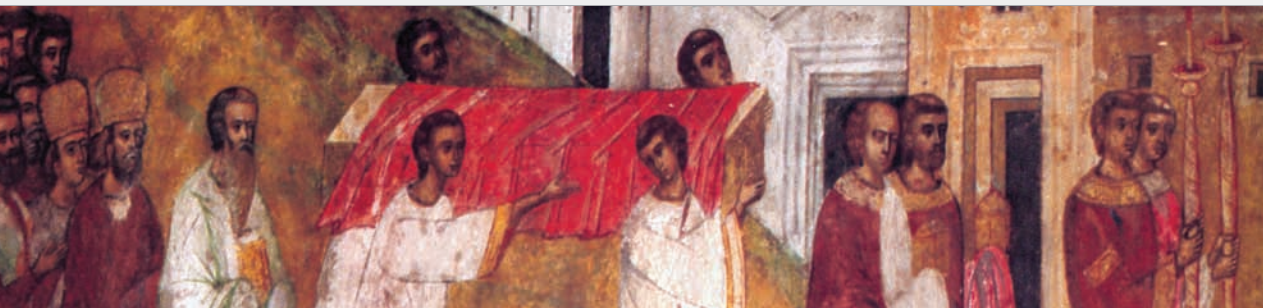
Aducerea moaștelor Sfintei Parascheva în biserica Sfinților Apostoli din Epivata