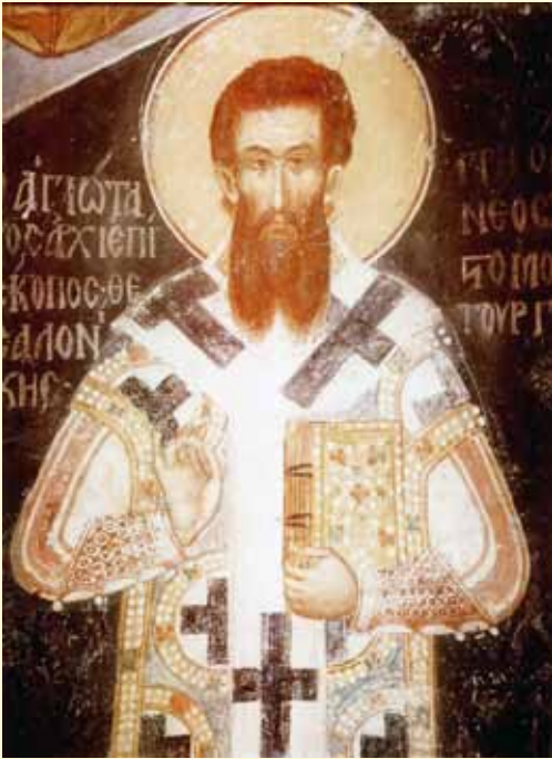
Sfântul Grigorie Palama