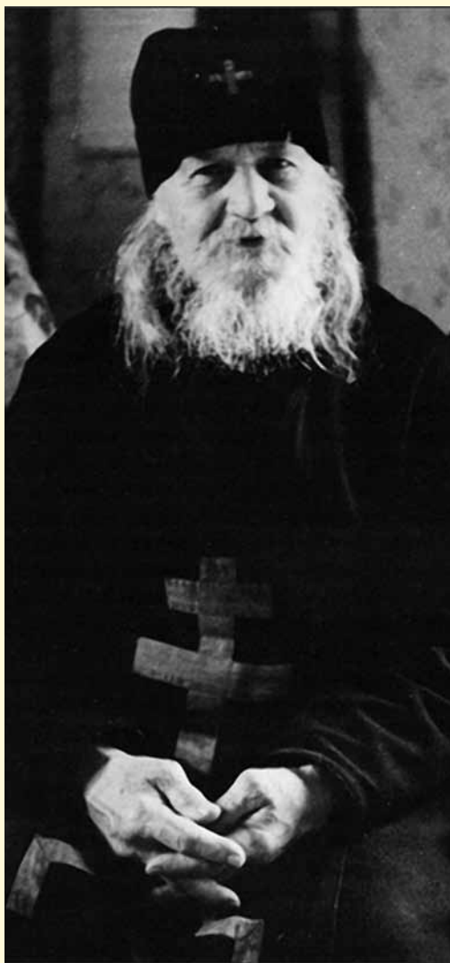
Cuviosul Ioan de la Valaam

Sfinții Părinți au expus în amănunțime în scrierile lor ceea ce trebuie să fie o