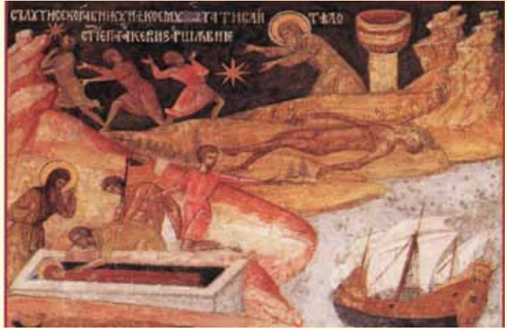
Sfânta Parascheva se arată unui corăbier oarecare luminând ca o stea

Într-o seară a venit la Sfânta Mitropolie o doamnă de 35 de ani, foarte agitată, emoționată până la lacrimi. Plângea și se închina la toa-te icoanele, dar mai ales la Cuvioasa Parascheva. După ce s-a mai liniștit am întrebat-o ce are. Și a zis că e foarte fericită și a venit să-i mulțumească lui Dumnezeu și Sfintei Parascheva. Mi-a povestit: