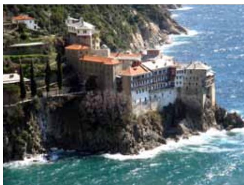
Sfânta Mănăstire a Cuviosului Grigorie Sfântul Munte Athos Nr. 249 / 8 august 2009

Iată că trupurile mărturisitorilor din temnițe, aruncate de comuniști la groapa comună, sunt astăzi împărțite spre cinstire și închinare în întreaga Biserică a lui Hristos! Să nu uităm faptul că pe moaștele mucenicilor s-au zidit dintotdeauna altarele pe care se săvârșesc Sfintele Liturghii.