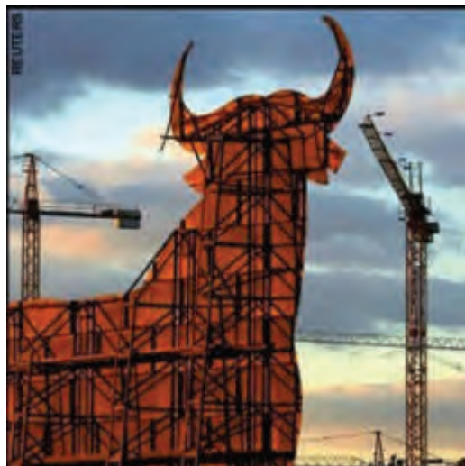
Noul Vițel de Aur al Noii Ordini Mondiale

Ce părere au însă alți economiști, e adevărat, ignorați și deliberat marginalizați, cum sunt cei cunoscuți sub numele de „libertarieni” sau Școala Austriacă? Pentru acești economiști, planul administrației Bush, prin care 700 miliarde dolari, bani publici, sunt folosiți pentru a fi dați instituțiilor financiare de credit care se găsesc în pericol de a falimenta, nu este altceva decât jaf la drumul mare. De ce? Pentru că acești bani provin din taxele