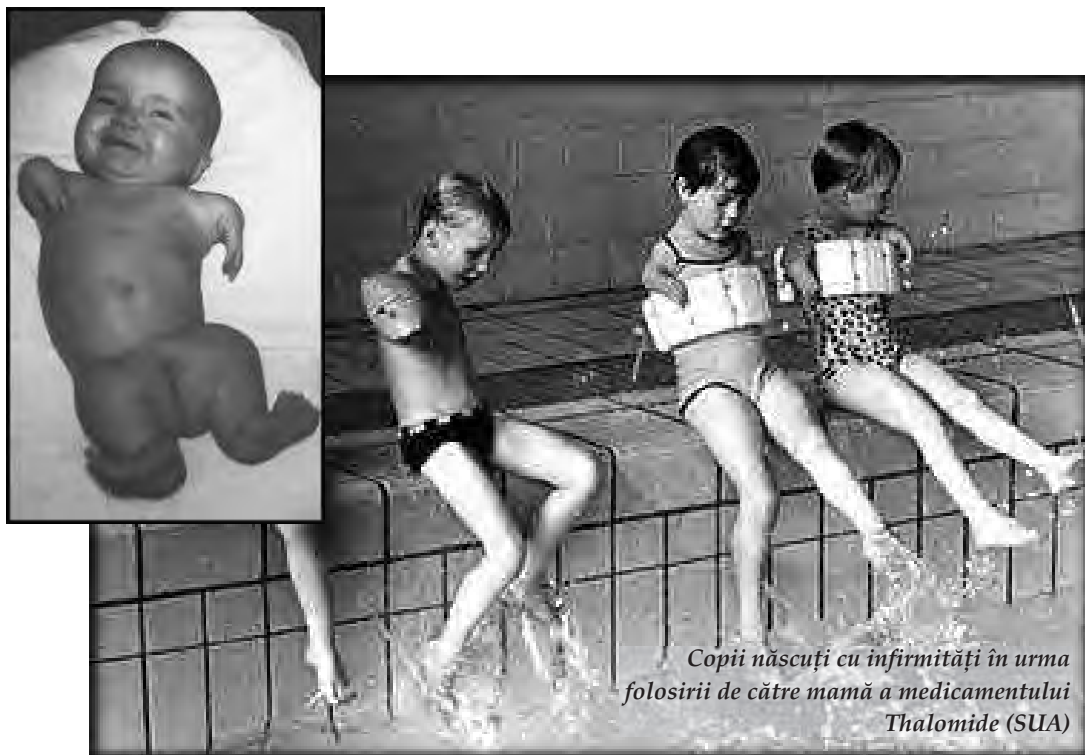
Copii născuți cu infirmități în urma folosirii de către mamă a medicamentului Thalomid (SUA)

retras de pe piață în 2004, iar Merck Frosst trebuie să facă față la mii de atacuri în justiție, cu cereri de prejudicii însumând miliarde de dolari. În Statele Unite se înregistraseră 6400 de procese pentru daune până în 2005, compania plătind, de exemplu, numai într-un singur caz 253 de milioane de dolari unei văduve al cărei soț a decedat ca urmare a unui „tratament” cu Vioxx. Nu mai vorbim despre cele peste 50.000 de decesuri care au fost atribuite acestui medicament.