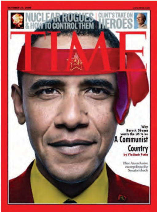
Imagine ce evocă tinerețea comunistă a lui Obama

această lume așa cum arată ea acum, mizeria din ea, joscnicia din jur, însă, în același timp, se îndârjesc să nu creadă Singurului Mântuitor, Nazarineanului Aceluia. Și, atunci, rezultatul acestei îndărătnicii de a nu crede Dumnezeu-ului Om este că sentimentul inadaptabilității în această lume se transformă într-o ură imensă, distrugătoare, față de tot ce înseamnă „lumea veche”. O răsturnare perfectă, o parodiare a sentimentului creștin de a „nu fi din această lume”, este sentimentul demonic nihilist de a voi să distrugi lumea, creația lui Dumnezeu, pentru a întemeia propria împărăție.